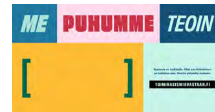
Rasismin vastainen kattositoumus