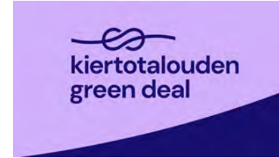
Kiertotalouden green deal